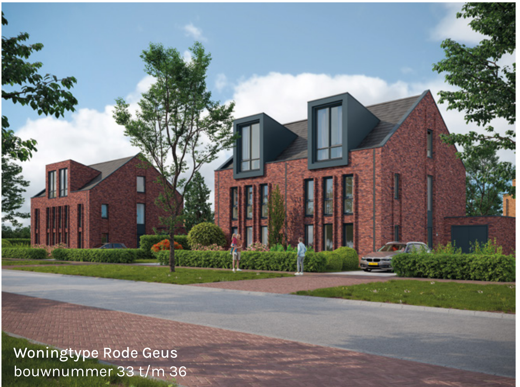
Woningtype Rode Geus bouwnummer 33 t/m 36

Aan de noordzijde van een van de groene hoven komen acht halfvrijstaande woningen in drie verschillende uitvoeringen. Vier woningen met een dwarskap, gelegen aan het dorpse straatje en vier woningen, direct gelegen aan het groen waarvan twee woningen drie-laags zijn met een dakterras en twee woningen, zogeheten specials, met dwarskap.